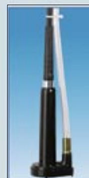
Pompe mécanique de coupe