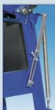
Réglage hauteur de coupe

La profondeur de coupe est réglable. La machine est prévue pour couper en multi-passes des matériaux épais. Hormis le nettoyage régulier de la cuve à eau, la machine n'exige que peu d'entretien.